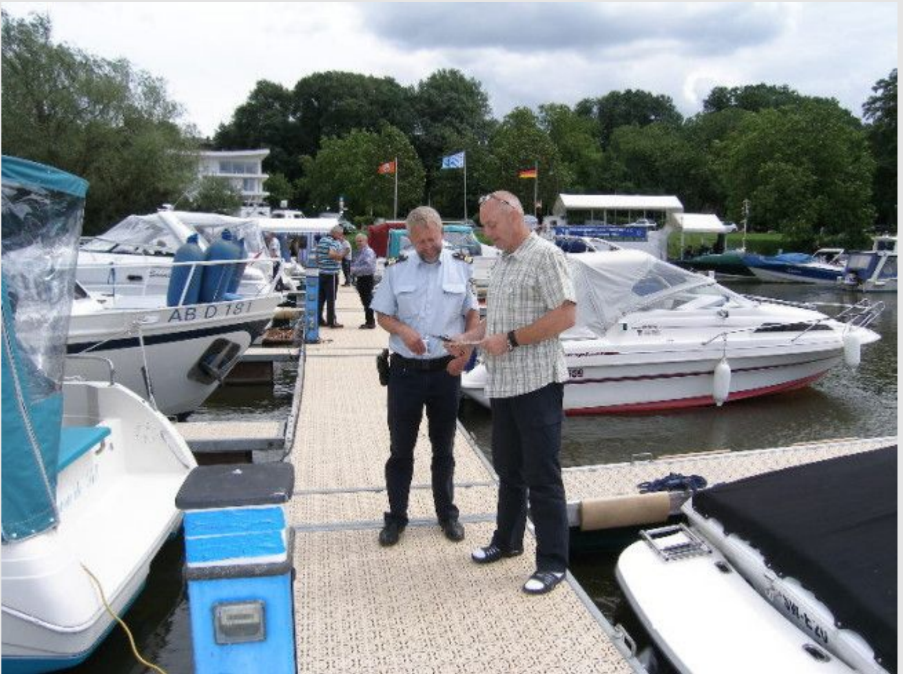
"Aufgeklart" an Bord des Bootes vom Vorsitzenden der WSF NEPTUN