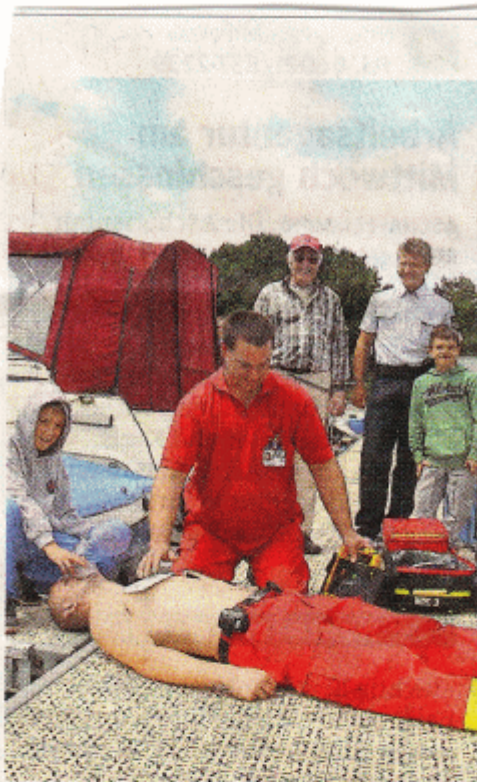
Rettung bei Notfällen auf dem Wasser: Ein Helfer der Wasserwacht erklärt im Aschaffener Floßhafen die Handhabung eines Defibrillators.